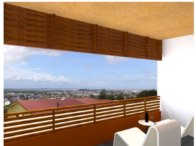
VUE DEPUIS LA TERRASSE DU T4