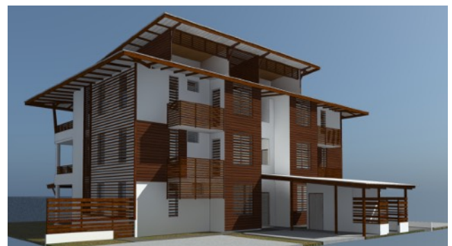
VUE 3D D'ETUDE