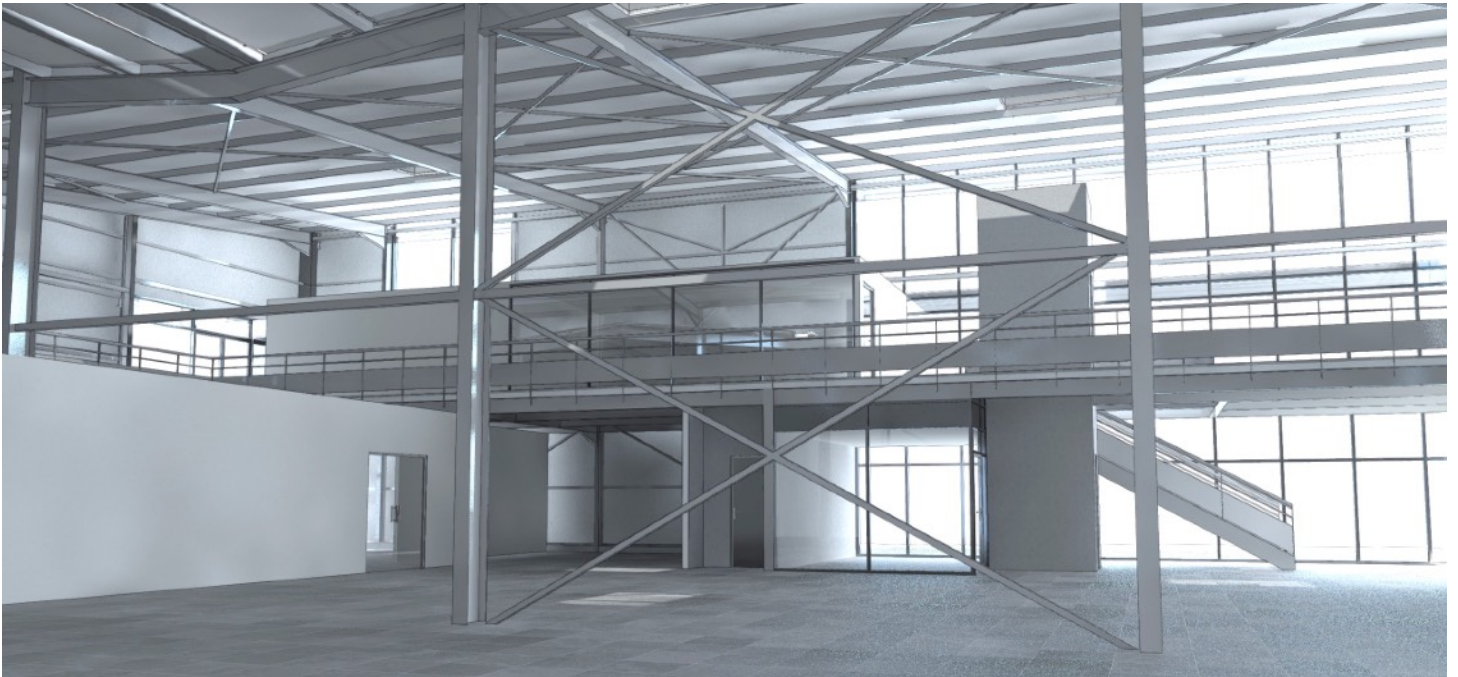
RELEVÉ ET RESTITUTION 3D D'UN BATIMENT EXISTANT + AMENAGEMENT INTERIEUR

Maitre d'ouvrage: privé Lieu: Cayenne (Guyane) Surface de Plancher: 4640 m 2 Coût: - Mission: Relevé - Autorisation de Travaux - Déclaration Prealable Cotraitants: - Phase: Mission terminée Livraison: Prévues courant 2023