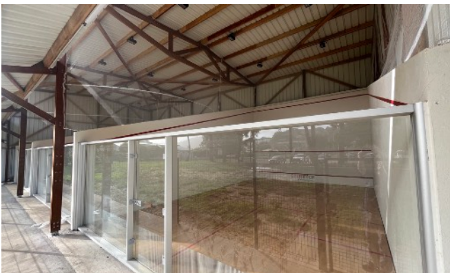
PHOTO INTERIEURE DU BATIMENT

Maitre d'ouvrage: Tennis Club Suzini Lieu: Remire (Guyane) Surface de Plancher: 208 m 2 Coût: 188k€ (hors équipements sportifs) Mission: Permis de Construire Cotraitants: IPCO Livraison: Livré en 2023