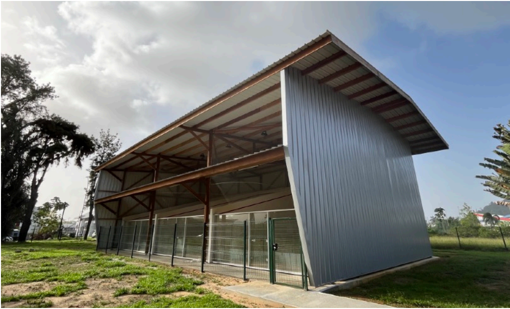
PHOTO EXTERIEURE DU BATIMENT

Maitre d'ouvrage: Tennis Club Suzini Lieu: Remire (Guyane) Surface de Plancher: 208 m 2 Coût: 188k€ (hors équipements sportifs) Mission: Permis de Construire Cotraitants: IPCO Livraison: Livré en 2023