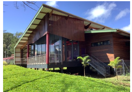
VUE EXTERIEURE DU RESTAURANT PEDAGOGIQUE