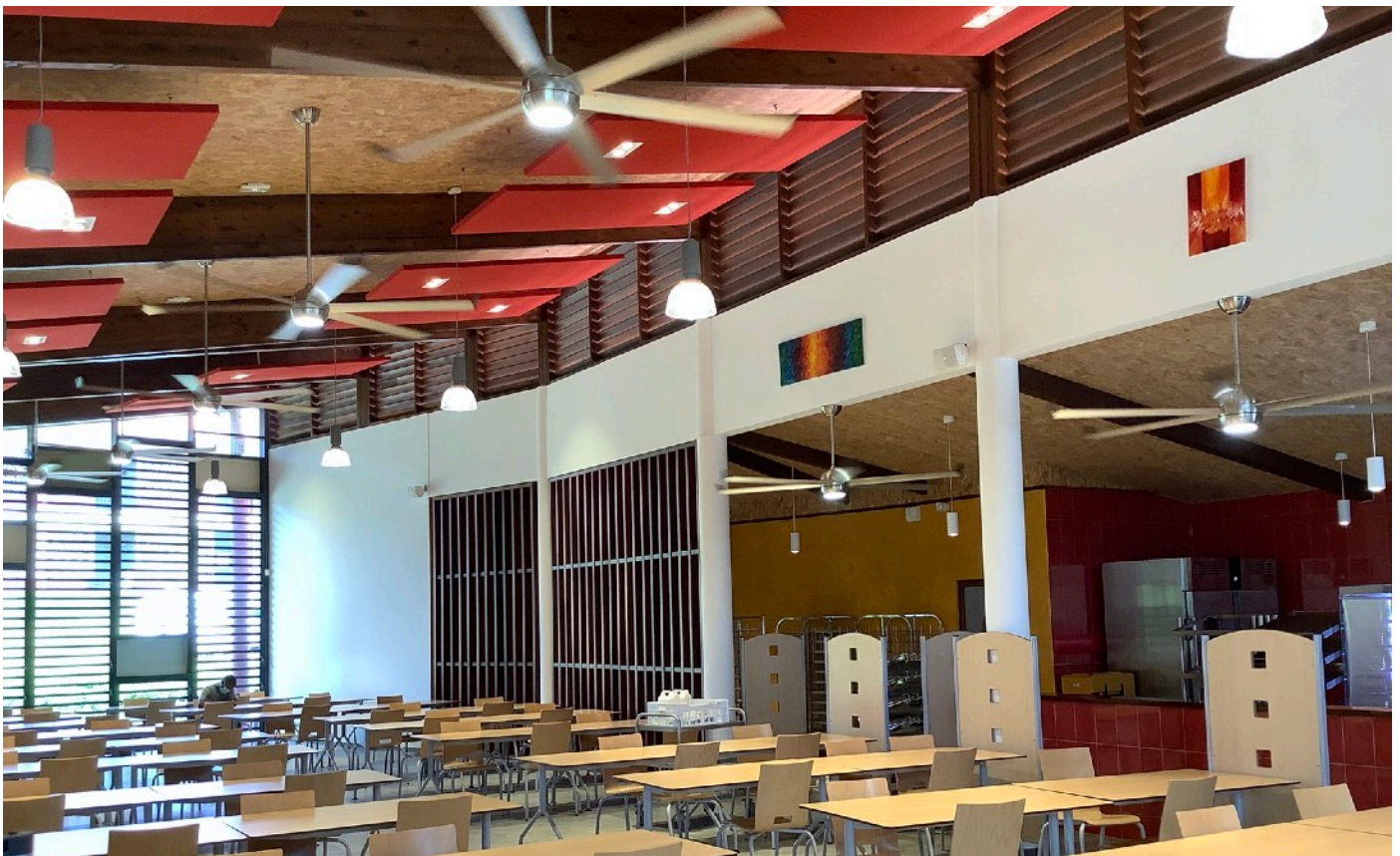
VUE DE L'ORDINAIRE