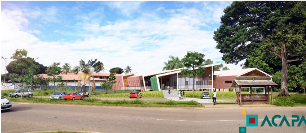
VUE 3D DU BATIMENT DEPUIS LA ROUTE DU TIGRE

Maitre d'ouvrage: RSMA Guyane Surface de Plancher: 1034 m 2 Coût: 3,6M € Mission SMYLE: VISA, DET, AOR en sous-traitance d'ACAPA SARL Architecte Mandataire: ACAPA Cotraitants: ATTA, SESIC, AGIR, OPUS, NOVOREST, ALTER Phase: livré novembre 2019