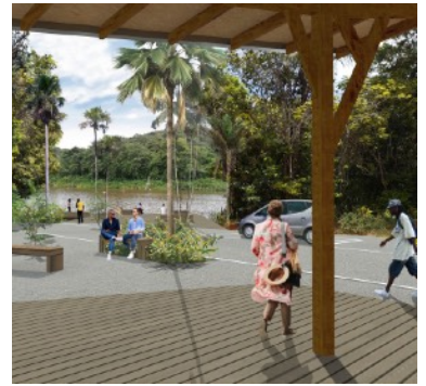
VUE 3D VERS LE LAC