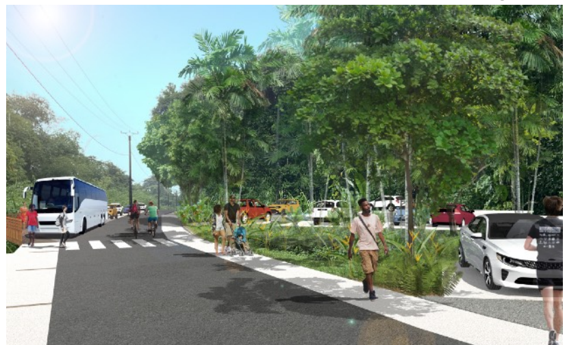
VUE 3D DU NOUVEAU PARKING