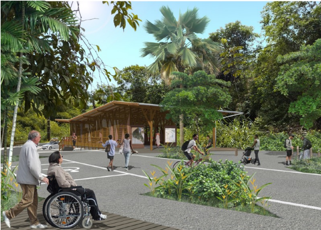
VUE 3D DU BATIMENT D'ACCUEIL ET PARVIS