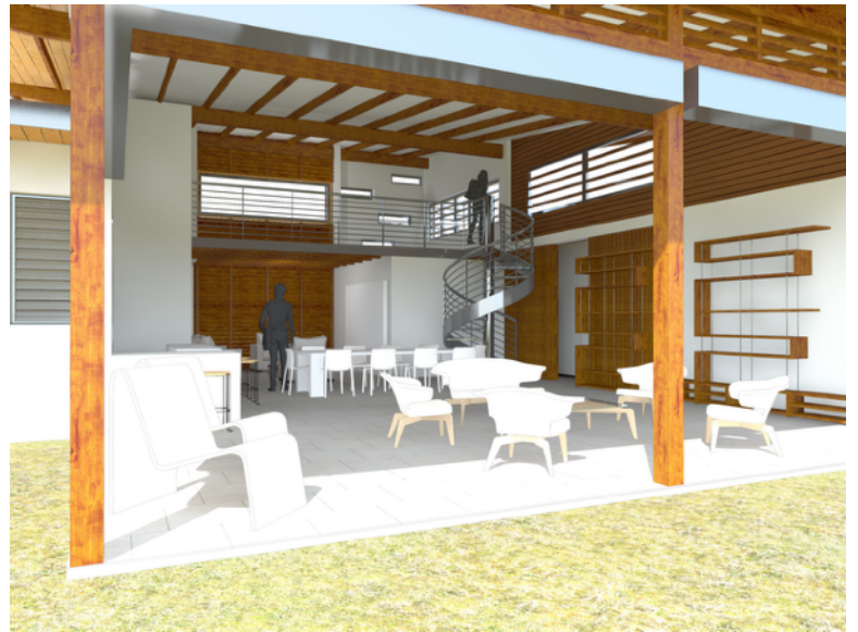
VUE DU SALON