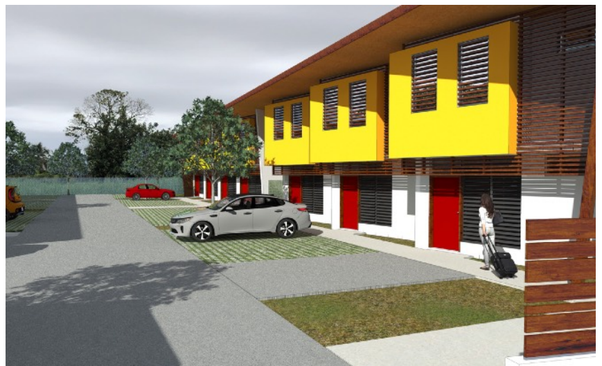
VUE DEPUIS LE PARKING