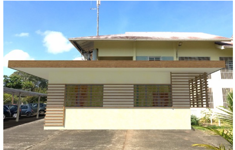
VUE 3D DE L'EXTENSION