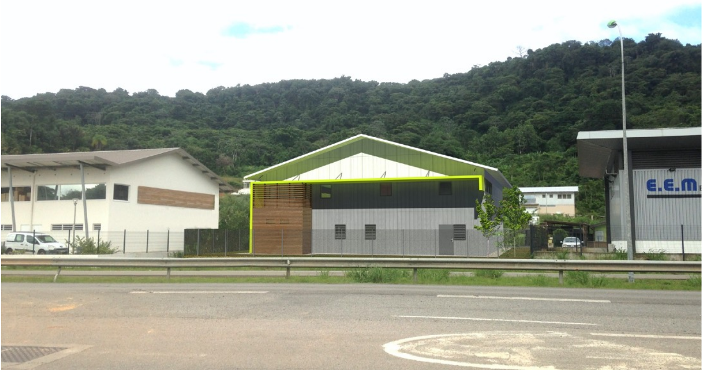
VUE DEPUIS LA ROUTE DE DEGRAD DES CANNES