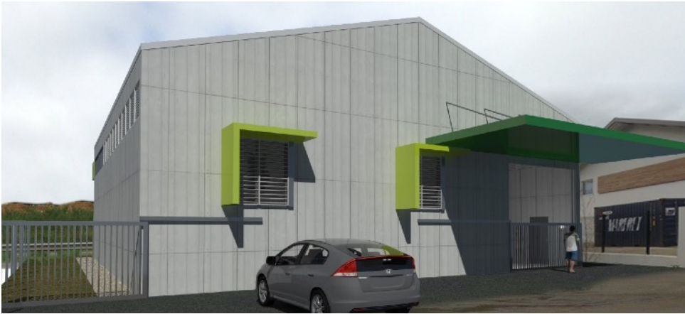
VUE DEPUIS L'INTERIEUR DU LOTISSEMENT

Maitre d'ouvrage: privé Surface de Plancher: 381 m 2 Coût: 300 000,00€ Mission: Permis de construire Cotraitants: BETEG Livraison: Permis obtenu en 2018