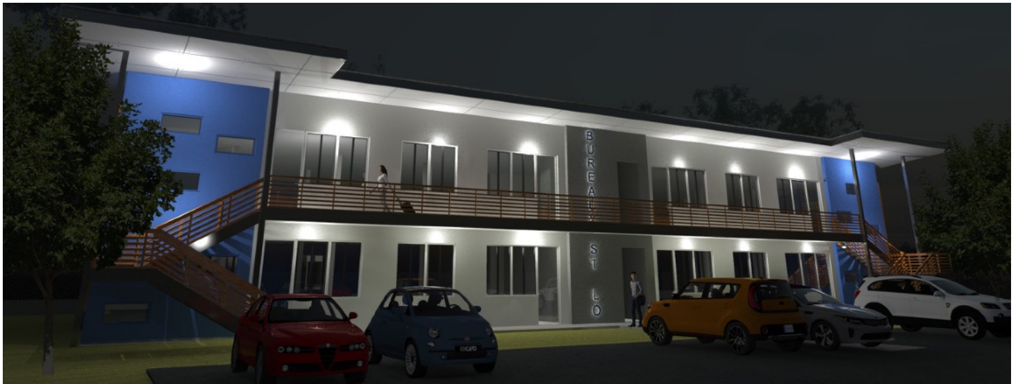
VUE NOCTURNE DEPUIS LE PARKING