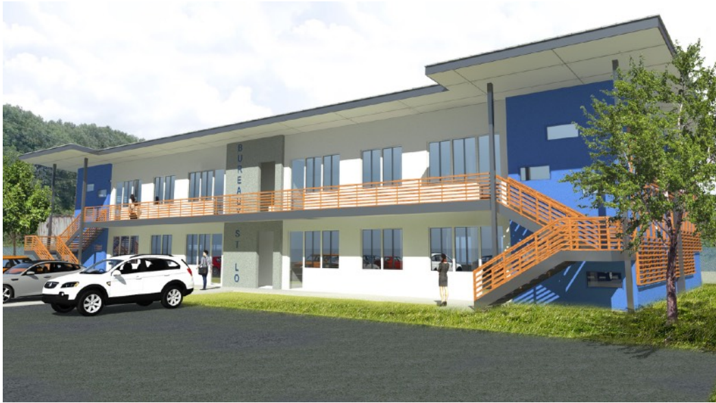
VUE DEPUIS LE PARKING

Maitre d'ouvrage: privé Lieu: Saint Laurent du Maroni (Guyane) Surface de Plancher: 1000 m 2 Coût: 1,3M€ Mission: PRO, VISA Cotraitants: IPCO, ATTA Phase: PRO