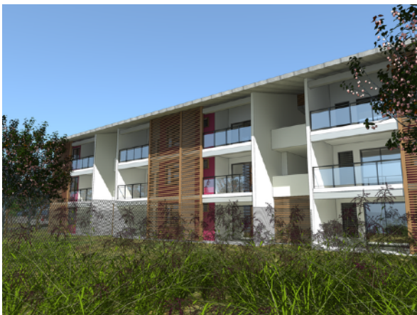
VUE 3D DE LA FACADE SUR JARDIN