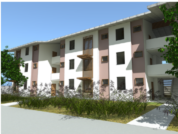
VUE 3D DE LA FACADE SUR PARKING