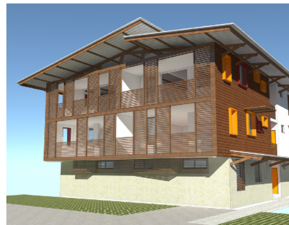
VUES 3D D'ETUDES